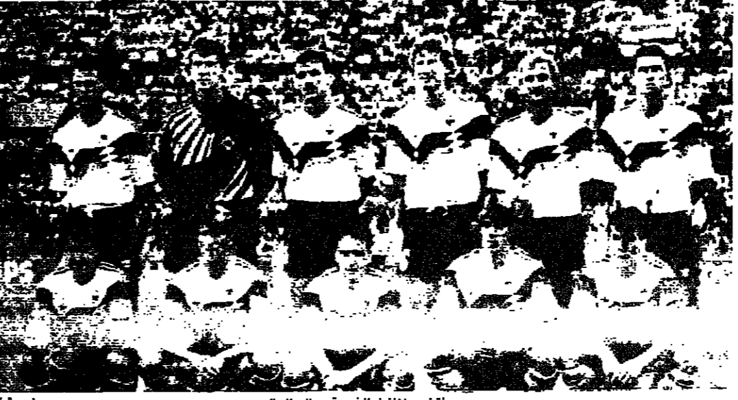
منتخب ألمانيا الغربية يفلح العالم